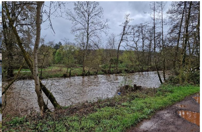
Prims im Verlauf zwischen Piesbach und Bilsdorf

Situation Vor allem bei Hochwasser führt die Prims Treibgut und Totholz, dass sich an den Brücken im Gemeindegebiet ansammelt, verklaut und die Hochwasserausbreitung an diesen neuralgischen Punkten verschärft. So kam es bspw. beim Hochwasserabfluss 2021 zum Zusetzen der Fußgängerbrücke in Bilsdorf (Foto oben links) durch Treibgut. Die Verklautungen an der Brücke führten dazu, dass die Prims umläufig wurde. Laut Anliegern besteht zudem ein Problem durch abgetriebenes Brennholz von Privatgrundstücken und durch den entlang der Prims abgelegten Rückschnitt von Bewuchs und Gehölzen sowie von gehäckseltem Material. Zudem wird der Weidenbestand kritisiert. Die Weiden ragen in den Abflussquerschnitt und brechen bei entsprechender Größe leicht ab und tragen damit auch zu potenziell kritischen Verklautungen bei.