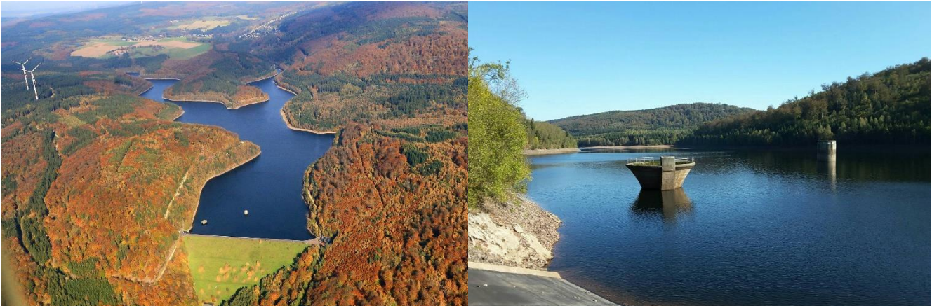
Blick auf die Staumauer