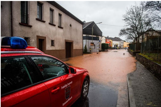
Starkregen in Bilsdorf 2016