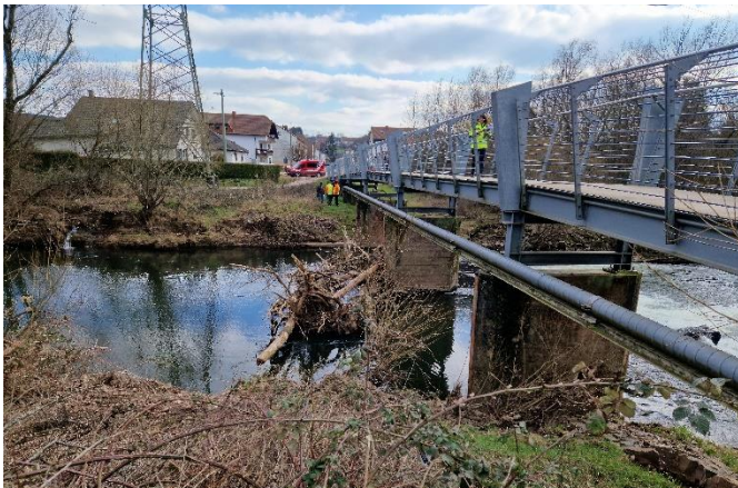
Anlandung von Totholz an der Fußgängerbrücke Bilsdorf