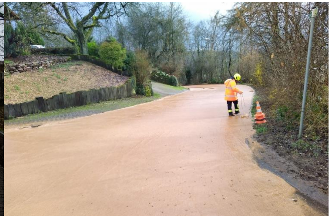
Starkregenabfluss in Piesbach 2023