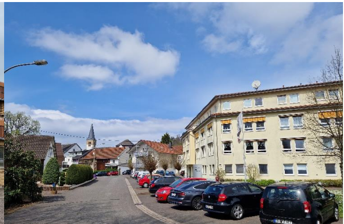
Primshochwasser gefährdeter Standort der Feuerwehr