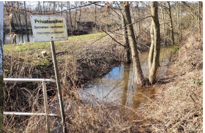
Weiheranlagen in Bilsdorf