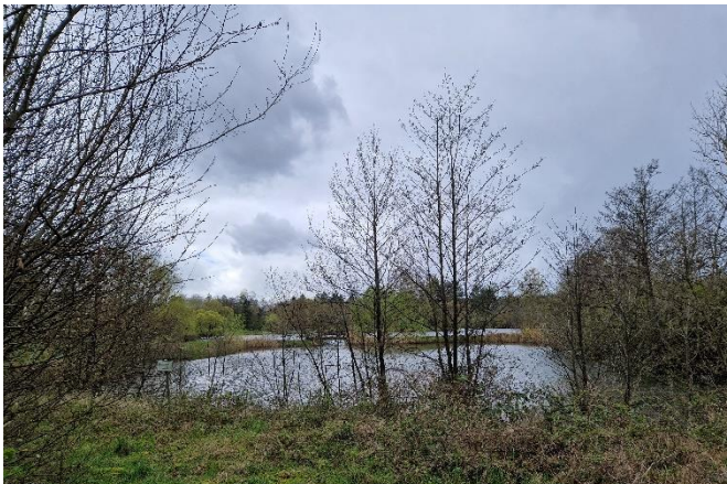
Weiheranlagen rechts der Prims in Piesbach