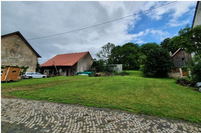
Unbebauter Bereich oberhalb der Bruder-Konrad-Straße