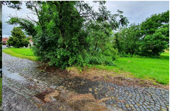
Tiefenlinie und Beginn des Gassenackerbaches unterhalb

Situation Breitflächige Abflusskonzentrationen sind von den Hangflächen (östlich) hinter der Bebauung bei Starkregen zu erwarten. Erfahrungen derart hat es noch nicht gegeben. Bislang konnten die Straßeneinläufe das Wasser, dass in der Straße anfiel, abführen. Straßeneinlauf unterhalb des Friedhofs an Kurve (links, Blickrichtung Tal) öffnen