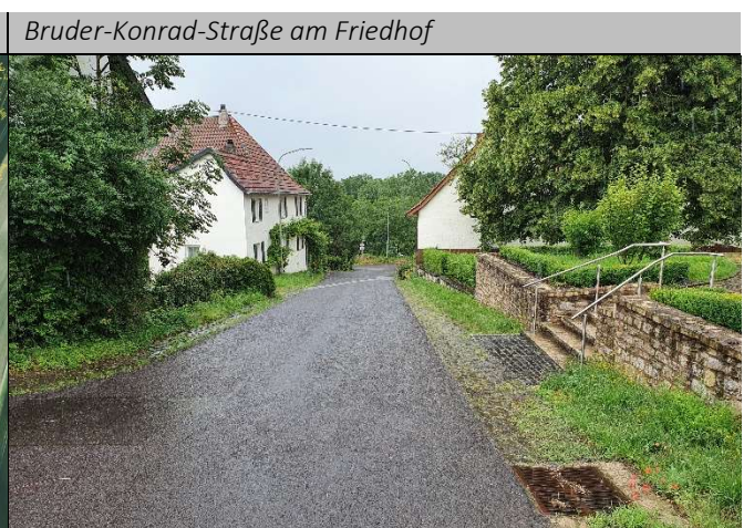
Bruder-Konrad-Straße am Friedhof